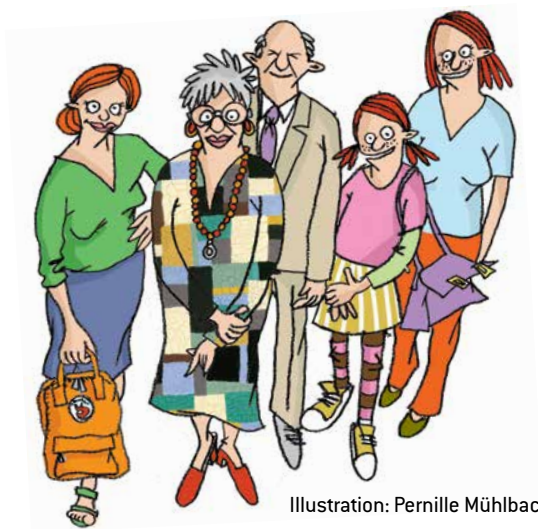
Illustration: Pernille Mühlbach