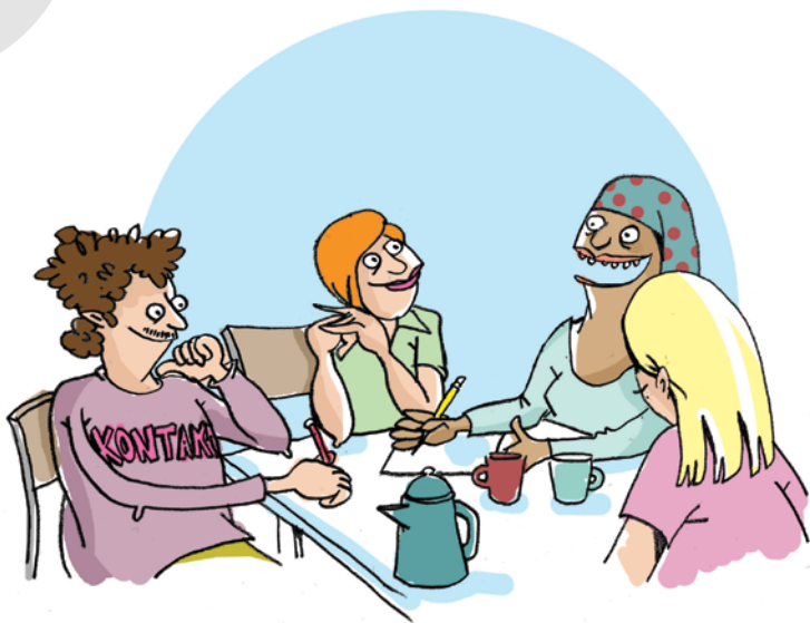
Illustration: Pernille Mühlbach