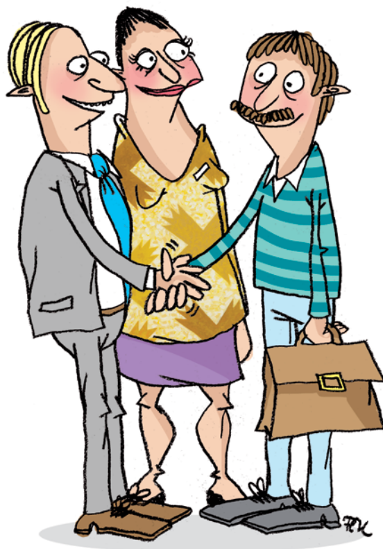
Illustration: Pernille Mühlbach