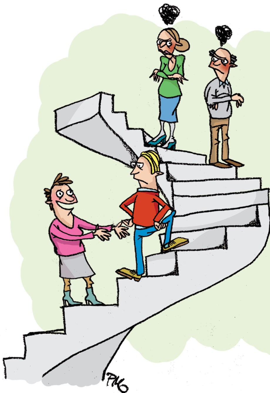
Illustration: Pernille Mühbach