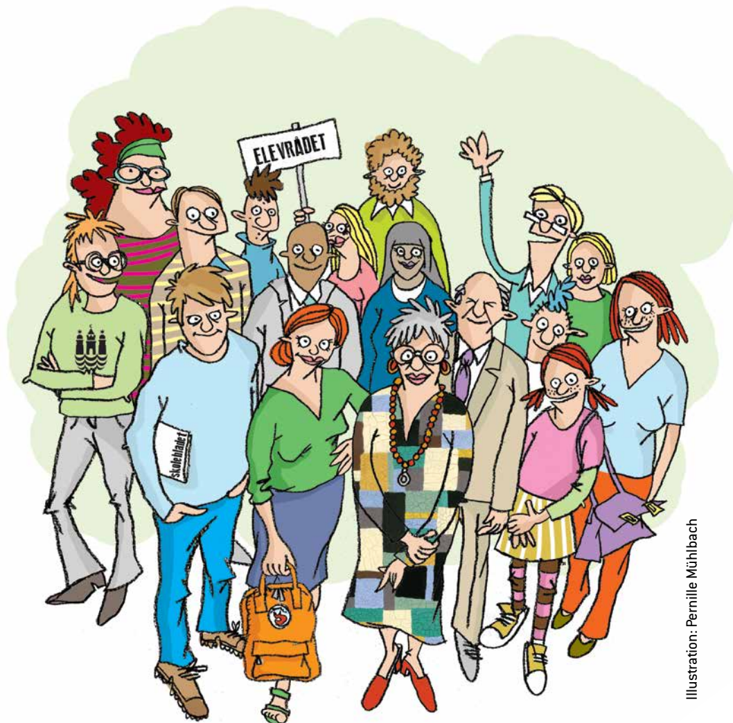
Illustration: Pernille Mühlbach

”Jeg har gjort det til en vane at svinge en tur forbi kontoret en morgen hver uge og spørge, hvordan det går. Det har været med til at skabe en afslappet stemning mellem lederen og mig.”