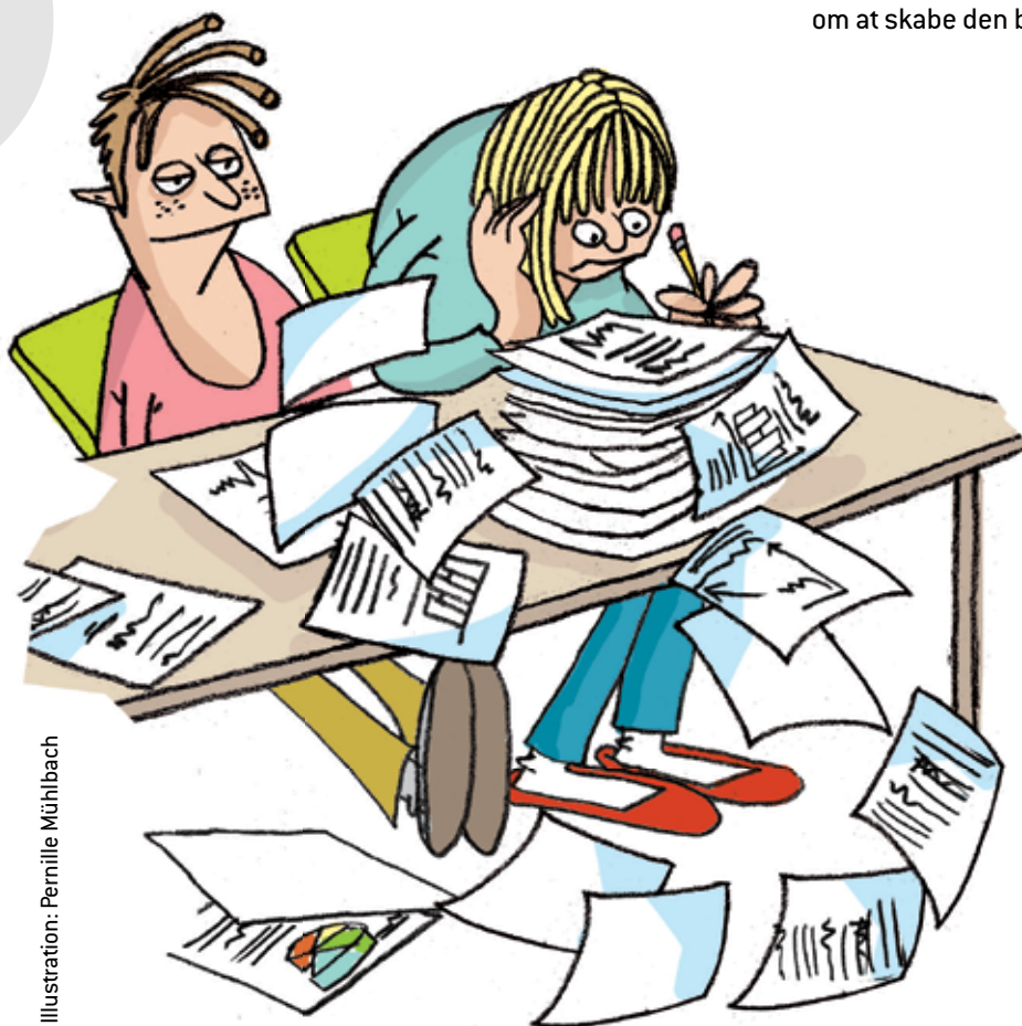
Illustration: Pernille Mühlbach

Det er sjældent befordrende for arbejdet for elevernes bedste, at der er konflikt. Man bør derfor så vidt muligt søge veje til fælles forståelse eller kompromis, for at kunne koncentrere sig om at skabe den bedste skole for eleverne.