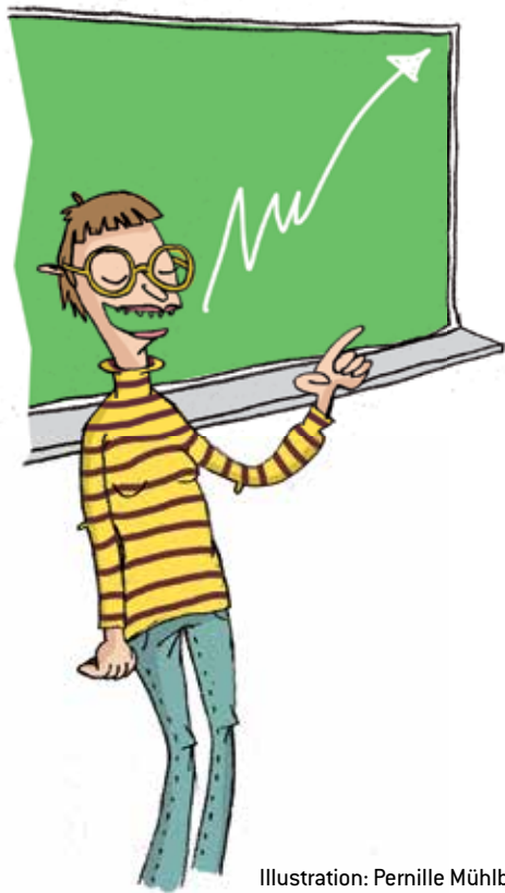
Illustration: Pernille Mühlbach