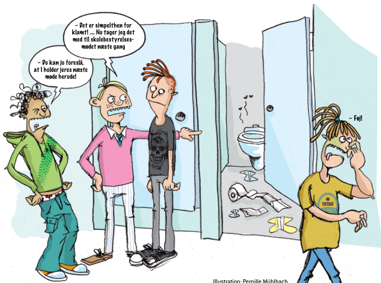
Illustration: Pernille Mühlbach