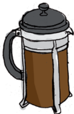
Illustration: Pernille Mühlbach

Bertel Haarders brev vedrørende personsager