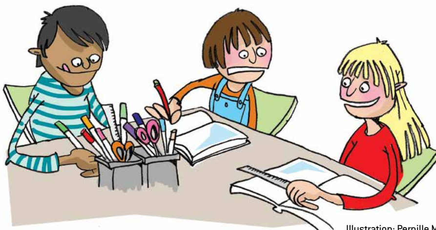
Illustration: Pernille Mühlbach

http://www.uvm.dk/skoletal : Ministeriet for Børn, Undervisning og Ligestillings hjemmeside om uddannelsesstatistik.