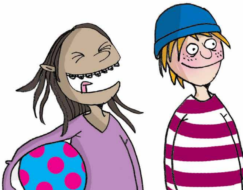
Illustration: Pernille Mühlbach