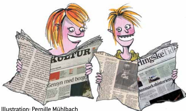
Illustration: Pernille Mühlbach