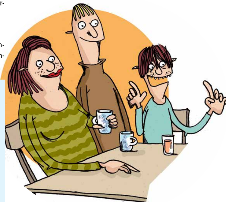
Illustration: Pernille Mühlbach

Ovenstående modeller kan naturligvis kombineres.