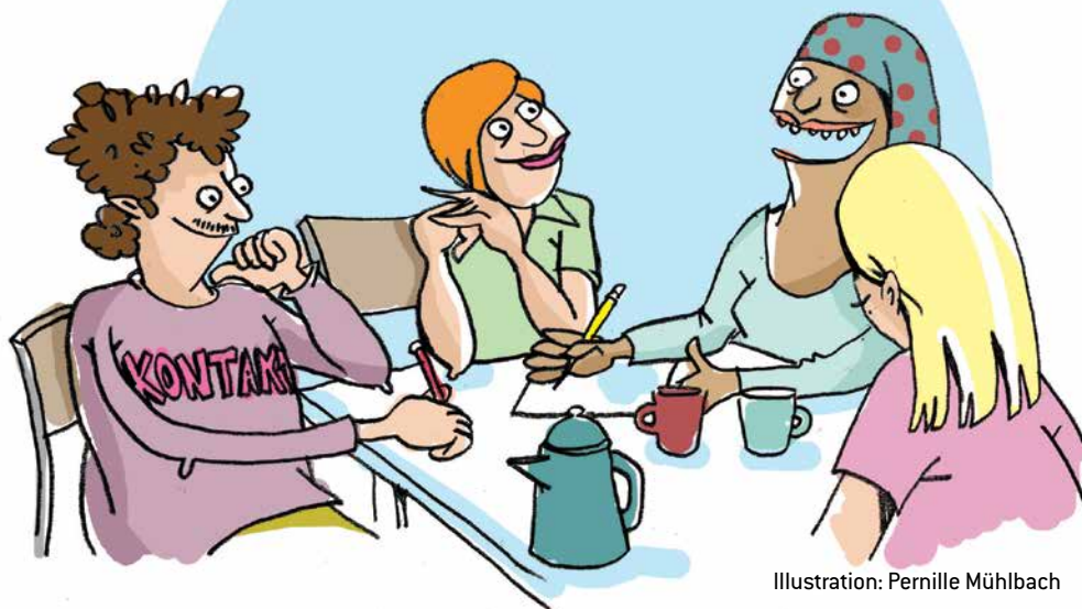
Illustration: Pernille Mühlbach