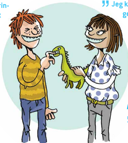
Illustration: Pernille Mühlbach

” Vores engelsklærer skrev på forældreintra om en særligt vellykket engelsktime – Yes!