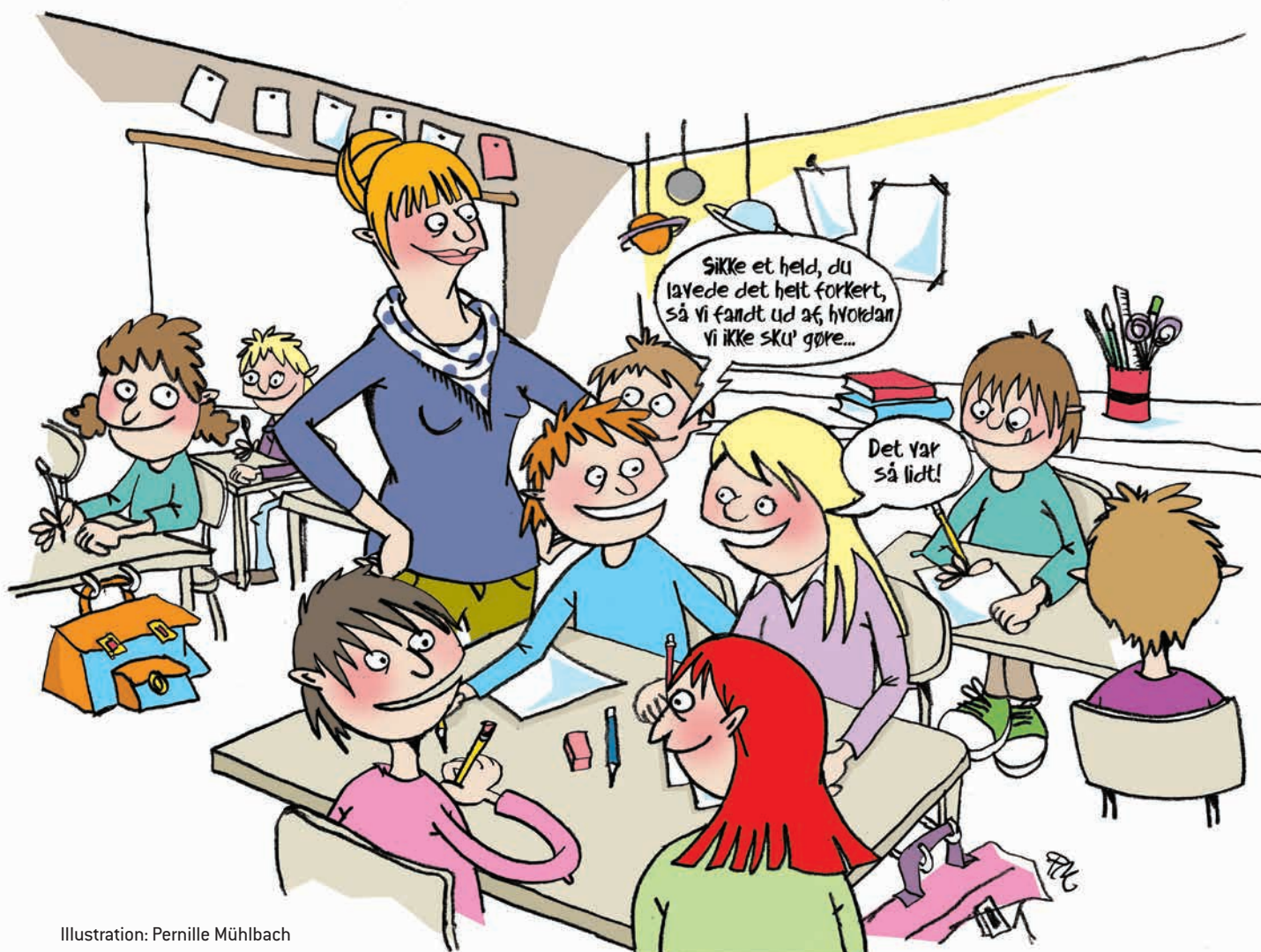
Illustration: Pernille Mühlbach

2) En form for feedback, der fokuserer på, hvad der kan gøres bedre fremover, frem for, hvad der kunne have været gjort bedre tidligere.