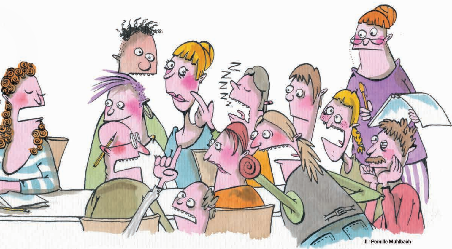
Ill.: Pernille Mühlbach

Husk, at ethvert valg i et budget også er et fravalg, og at I ikke 'redder' skolens arbejde med elevernes læring ved én hurtig manøvre et enkelt år.