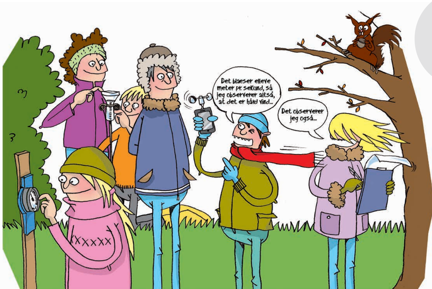
Illustration: Pernille Mühlbach

Når eleverne ved, hvad de skal lære, og når læringsmålene er realistiske at nå, lærer de mere og bedre. De ved, hvor de skal hen, og dermed hvor de skal lægge deres energi. Samtidig kan læringsmålene give en større samhørighed mellem lærer og elev, der arbejder side om side for at nå et bestemt sted hen. Læreren kan opsætte læringsmålene, baseret på en vurdering af elevens forudsætninger, eller læreren og eleven (og eventuelt forældrene) kan opsætte dem sammen. Målene skal være tydelige og synlige for eleverne – og også gerne for forældrene.